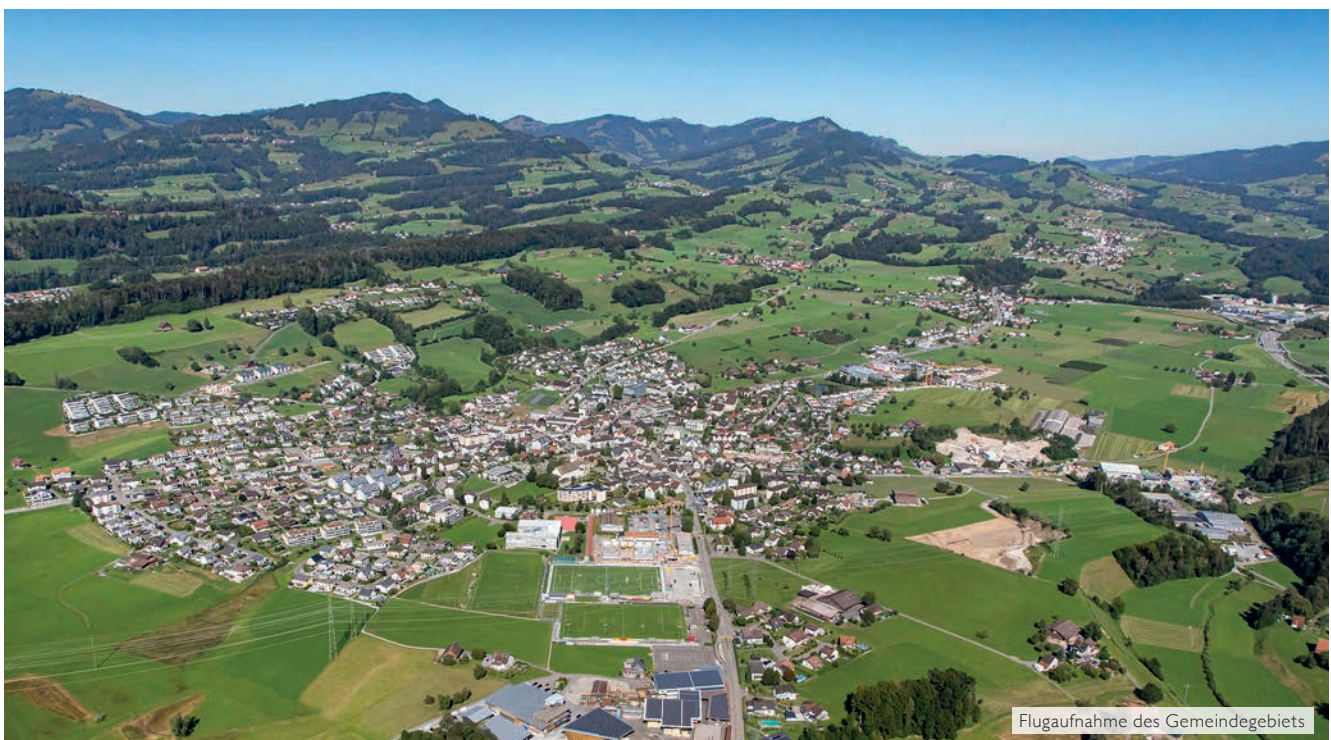
Flugaufnahme des Gemeindegebiets