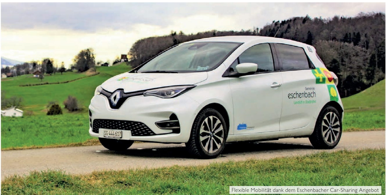
Flexible Mobilität dank dem Eschenbacher Car-Sharing Angebot

Die Gemeinde Eschenbach bietet das Elektromobil mit einer Reichweite von 300 Kilometern im degressiven Preismodell an. Längere Fahrten (ab sieben Stunden) werden also noch günstiger. Bezahlt wird bequem per Monatsrechnung. Es sind keine Grundgebühren oder Mitgliederbeiträge fällig. Bei Sponti-Car bezahlt man nur, wenn man eines der Fahrzeuge auch tatsächlich nutzt. Eine ideale Gelegenheit, für alle, die sich mit der E-Mobilität anfreunden und diese ausgiebig testen wollen.