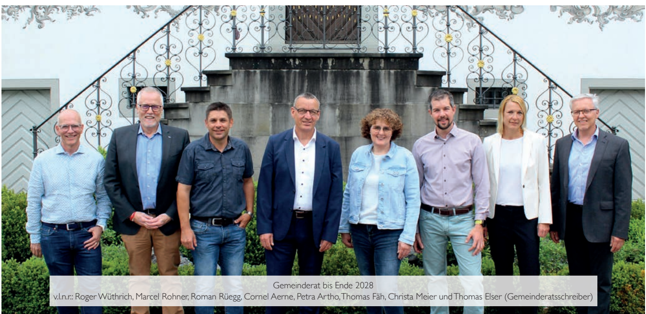
Gemeinderat bis Ende 2028