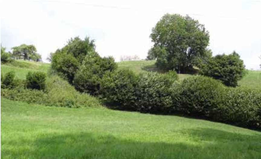
Hecke mit Krautsaum