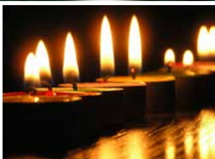
Sicherheit in der Adventszeit

Abfall- kalender 2017 in der Mitte dieser Ausgabe