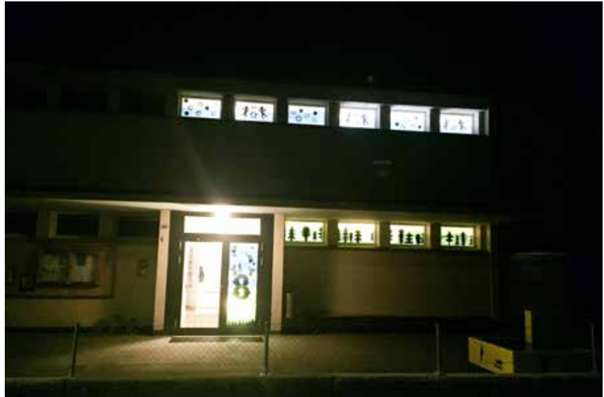
Adventsfenster »Nr. 8« im Schulhaus Walde