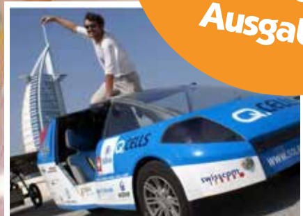
Projektarbeit der 3. Oberstufe Kick-Off mit Louis Palmer