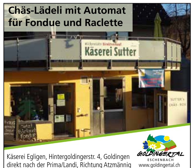
Chäs-Lädeli mit Automat für Fondue und Raclette

Käserei Egligen, Hintergoldingerstr. 4, Goldingen direkt nach der Prima/Landi, Richtung Atzmännig