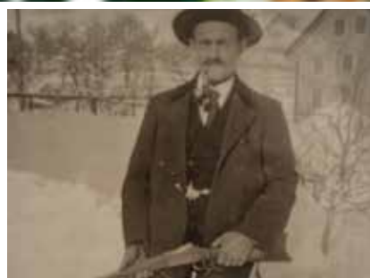
Neujahrswanderung am 7. Januar 2017