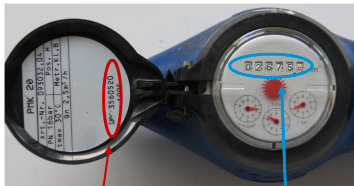
Zähler-Nummer z.B. 3560520